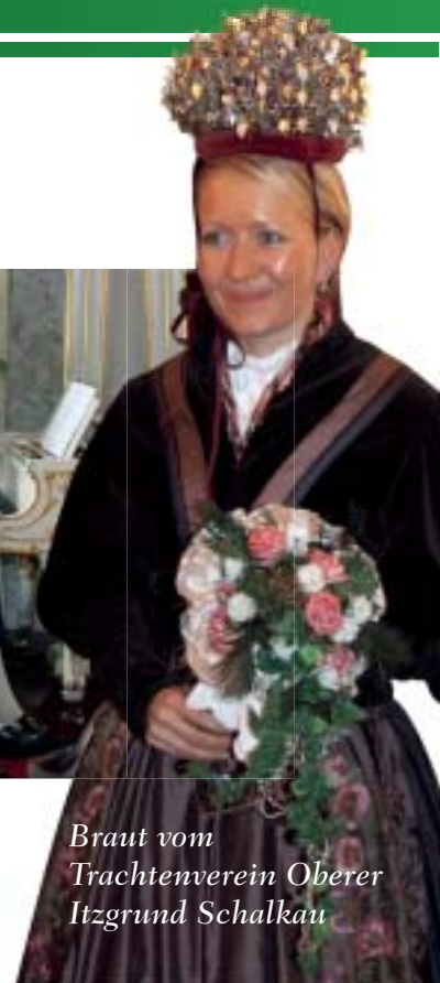
Braut vom Trachtenverein Oberer Itzgrund Schalkau