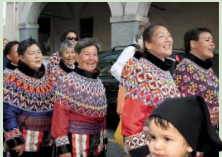
Die Europeade lockt auch Mitwirkende aus dem fernen Grönland.