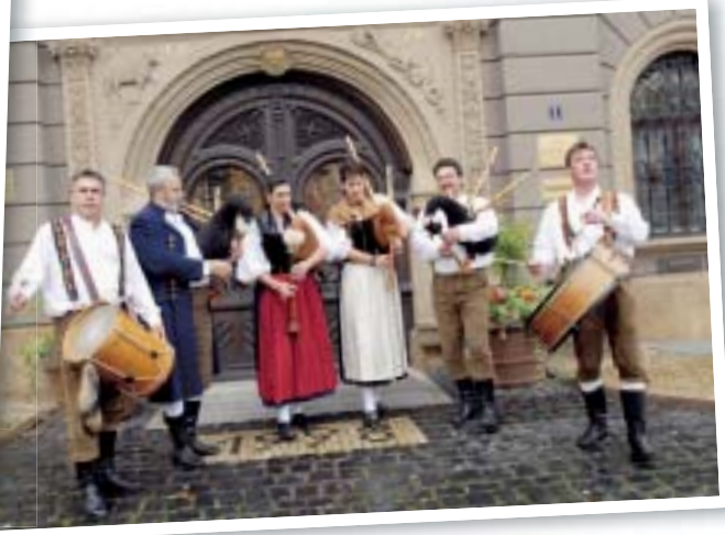
Die Thüringer Spielleut' freuen sich bereits auf die 50. EUROPEADE.