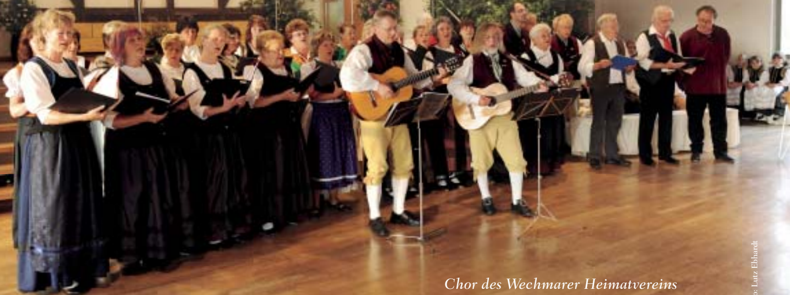
Chor des Wechmarer Heimatvereins und die Gesangsvereinigung Seebergen