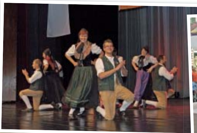
Die Folkloregruppe Trusetal macht Stimmung.