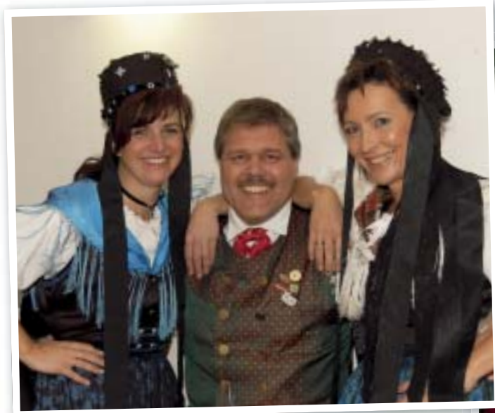
Die Mitglieder der Thüringer Trachtengruppe der Sieben Täler Tambach-Dietharz.