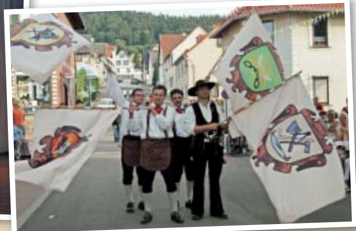
Die Thüringer Landstrachtengruppe-Fahnschwinger