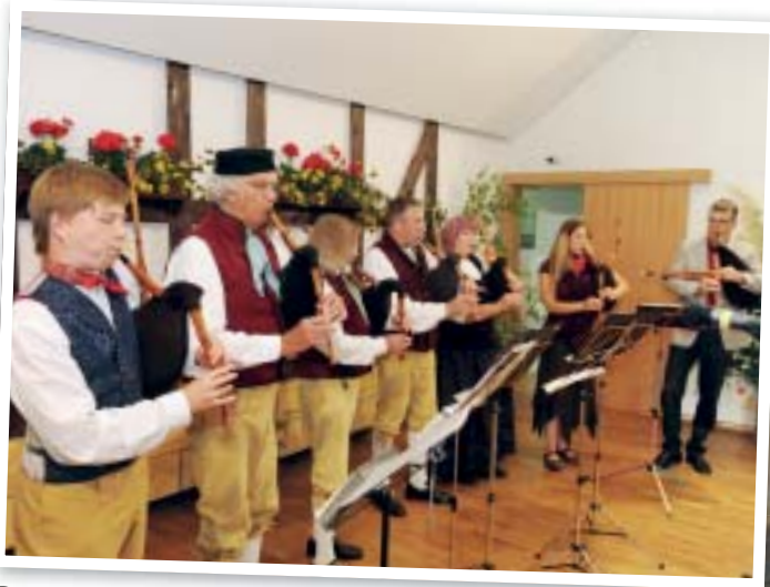
Die Weimarer Mühlenpfeiffer haben noch viel Luft für die 50. EUROPEADE.