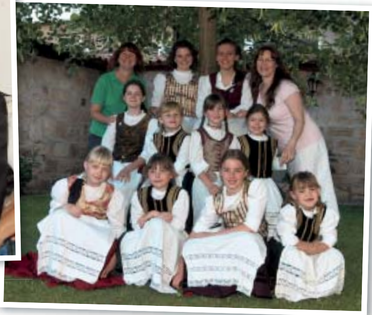
Die Studnitztänzer verzaubern das Publikum.