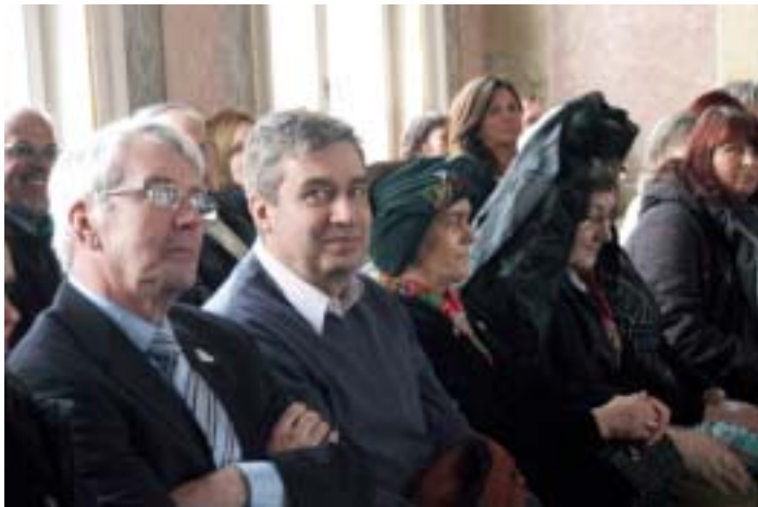
Der Präsident a.i. des Internationalen Europeade-Komitees Armand De Winter (links) und der Präsident des Deutschen Europeade-Komitees Rüdiger Heß zur Ausstellungseröffnung.